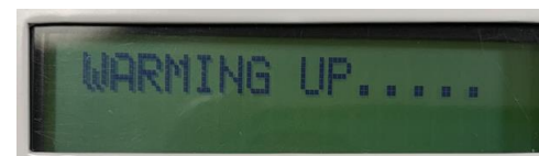
画面2 ウォームアップ画面