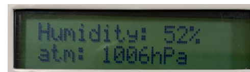
画面 3-2 湿度と大気圧

4) 電源をオフにするには、MG-CS10NEW の右側面にある DC ジャックから AC アダプタのプラグを取り外します。