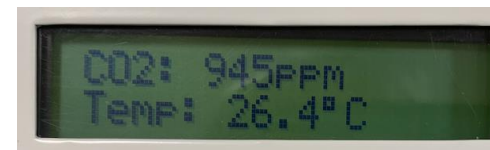
画面 3-1 CO2 濃度と温度